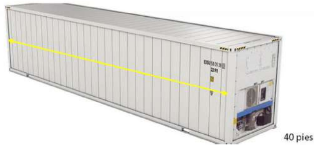
Imagen del contenedor (solo como referencia)